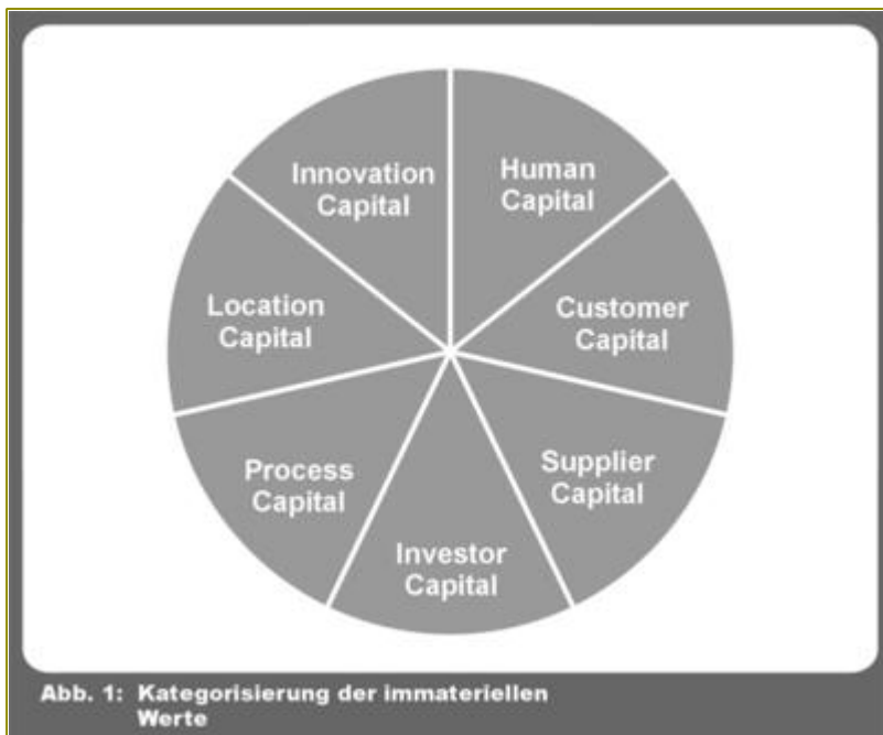
Abb. 1: Kategorisierung der immateriellen Werte